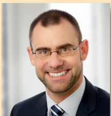
Ralph Edelhäuber 1. Bürgermeister Stadt Roth