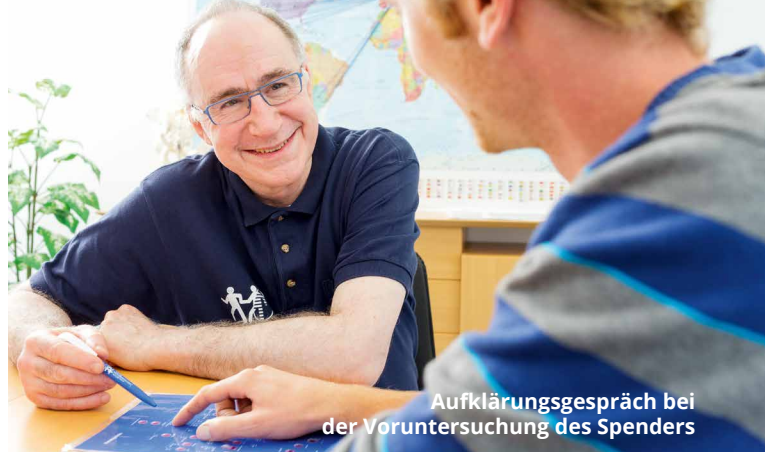
Aufklärungsgespräch bei der Voruntersuchung des Spenders